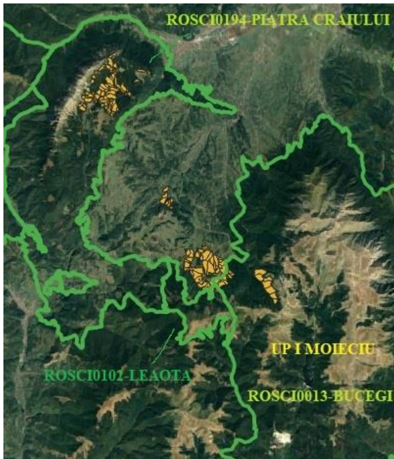
Foto.1 –Relatia fondului forestier din cadrul UP I Moieciu cu siturile de importanta comunitara ROSCI0194 Piatra Craiului , ROSPA0165-Piatra Craiului , ROSCI0013-Bucegi si Parcul Natural Bucegi, ROSCI0102-Leaota